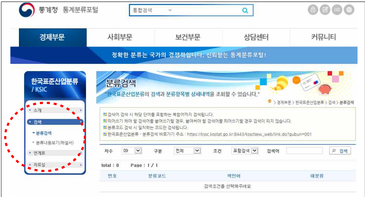
3. 한국표준산업분류 검색 클릭