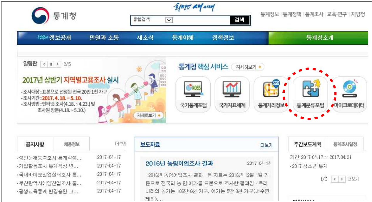
1. 통계청 홈페이지 접속

[참고자료] 통계청 홈페이지 통계분류포털 접속 방법(http://kssc.kostat.go.kr)