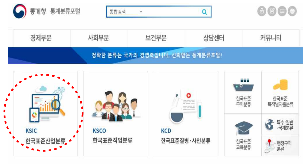
2. 통계청 통계분류포털 홈페이지 접속 후 한국표준산업분류 클릭